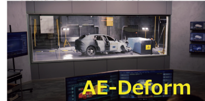
静岡県産業振興財団 令和5年度、6年度 次世代自動車技術革新対応促進助成事業（事業化型）成果物